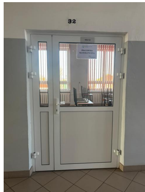
Na zdjęciach przedstawiono pracownie o numerze 34 i 32.

W przypadku trudności z poruszaniem się, wszelkie sprawy można załatwić mailowo lub telefonicznie. Można skorzystać również z pomocy pracownika w czasie poruszania się po szkole.