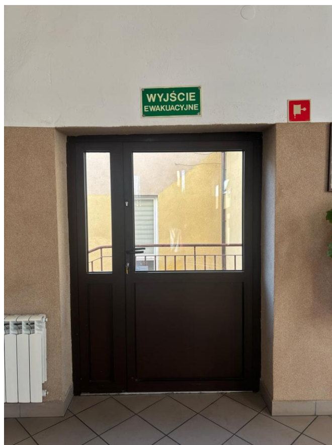
Na zdjęciu przedstawiono przejście na plac apelowy.

Na prawo od pomieszczenia obsługi znajduje się przejście na plac apelowy.