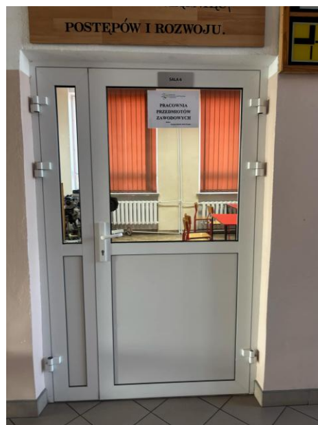
Na zdjęciach przedstawiono pracownię lekcyjną 6 i 8.

Na prawo od pomieszczenia obsługi znajduje się przejście na plac apelowy.