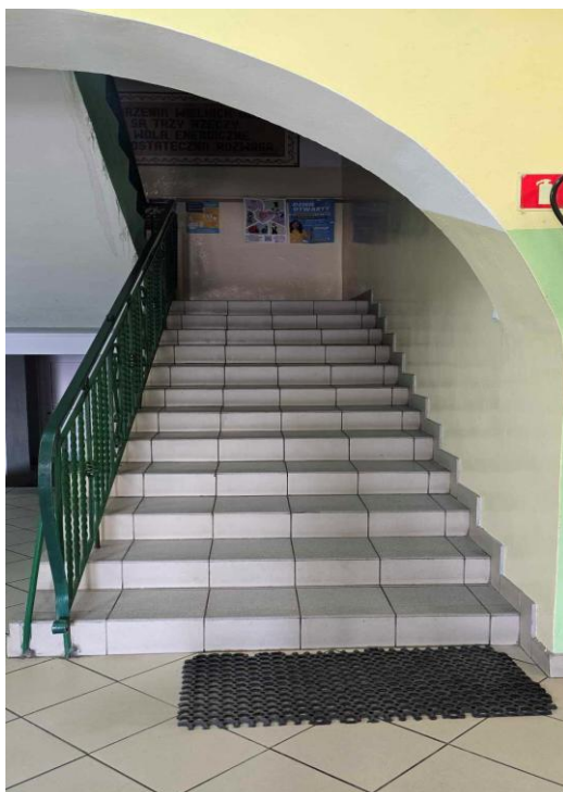
Na zdjęciu przedstawiono główną klatkę schodową.

Na wprost od głównego wejścia znajduje się główna klatka schodowa prowadząca na 1 piętro.