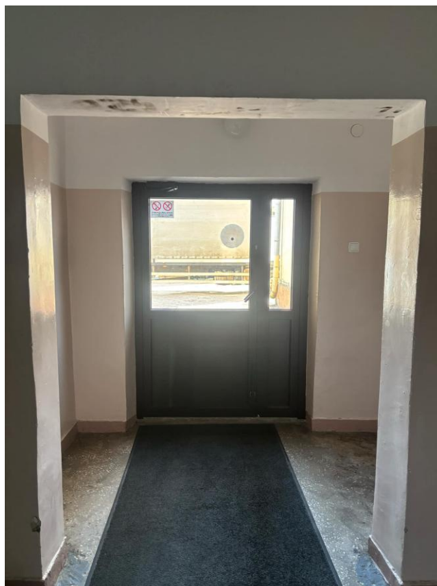
Na zdjęciu przedstawiono przejście na warsztaty.