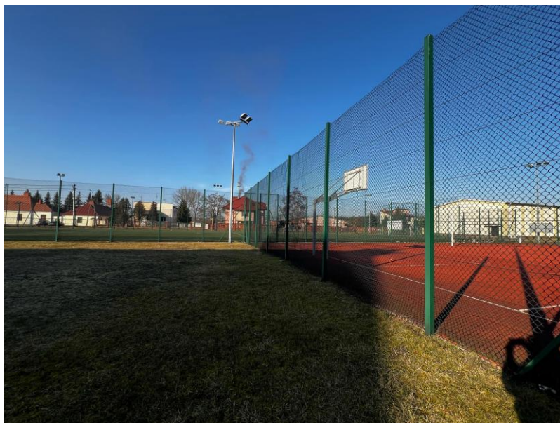
Na zdjęciu przedstawiono orlik.

Idąc w dół na klatce schodowej znajdują się uczniowskie szatnie.