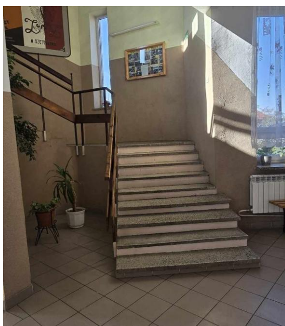
Na zdjęciach przedstawiono klatkę schodową prowadzącą w dół – do szatni i w górę do biblioteki, radiowęzła i 2 pracowni lekcyjnych.

Idąc w górę od klatki schodowej znajduje się kolejno, biblioteka, radiowęzeł szkoły i 2 pracownie lekcyjne.