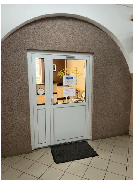
Na zdjęciu przedstawiono sekretariat szkoły.

Na pierwszym piętrze szkoły znajduje się sekretariat szkoły oraz 4 pracownice lekcyjne. Na 2 piętrze znajdziemy pokój nauczycielski, biuro administracji i księgowości, 2 pracownice do nauki języków obcych wraz z przejściem na salkę gimnastyczną.