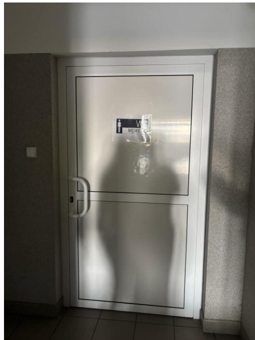
Na zdjęciach przedstawiono wejścia do toalet.