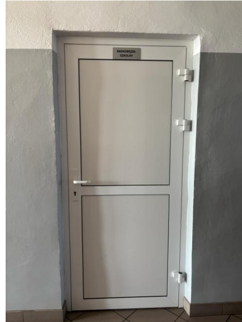
Na zdjęciach przedstawiono wejście do biblioteki szkolnej i radiowęzła.